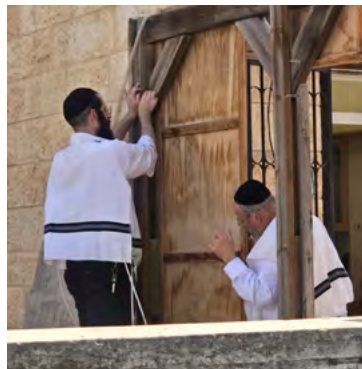
סוכה כהלכתה

מלהיות דופן לסוכה. הלכה זו נוגעת גם לאופן שחלק מהדופן גבוה מהרצפה, שחלק זה לא יכול להיחשב כחלק מדפנות הסוכה.